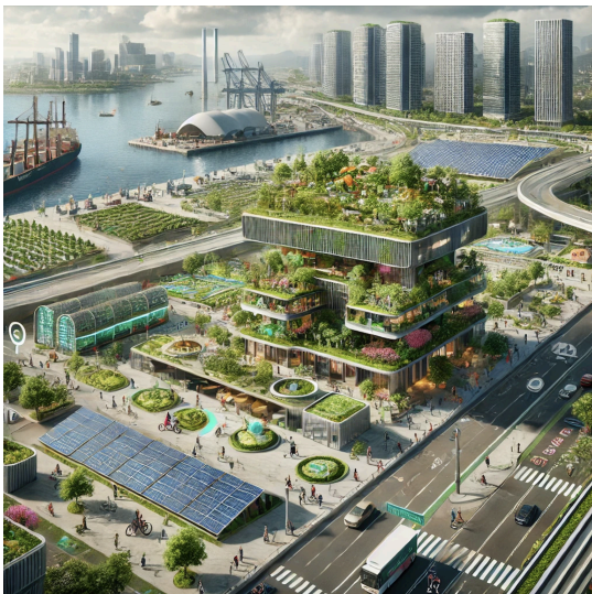
Exemples d'un croquis architectural à l'échelle d'une rue et d'un schéma urbanistique à l'échelle d'un quartier illustrant des projets de végétalisation